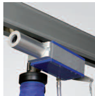
Eiettore SEM 100