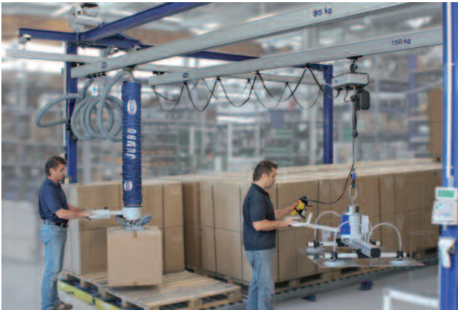
Gru a singola trave in alluminio, carico 85 kg ovvero 150 kg, 2x6 m ovvero 4x6 m

Grazie ai nostri servizi di consulenza e progettazione, ispezione e manutenzione, con noi sarete sempre al sicuro! Ovviamente Schmalz effettua anche il collaudo annuale fornendo tutte le prestazioni necessarie.