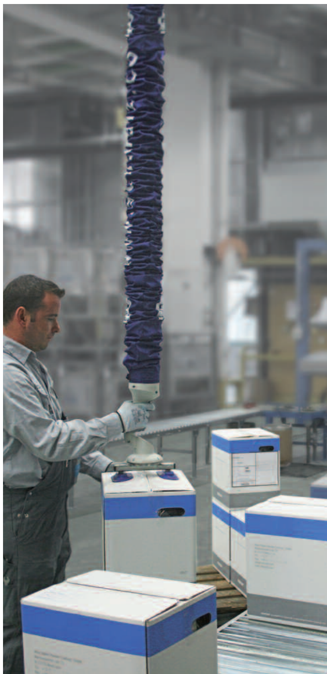
JumboFlex, carico 35 kg con ventosa doppia, per la movimentazione di cartoni nel settore della spedizione