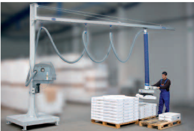
Gru girevole a colonna con rotaie in alluminio, carico 65 kg, lunghezza braccio con piastra di base 5 m