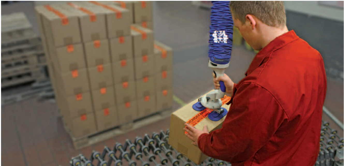
JumboFlex, carico 35 kg con ventosa doppia per la movimentazione di cartongaggi

Movimentazione dei pezzi flessibile ed efficace