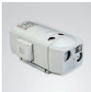
Pompe a vuoto EVE 25/40

È possibile scegliere tra diversi produttori di vuoto: